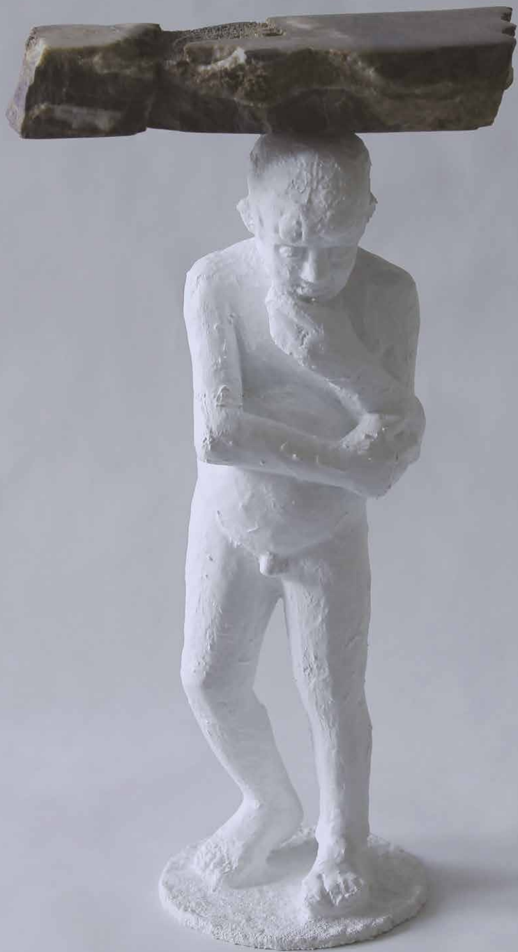
Miro Trubač: Vlast', 2019, kolorovaný epoxid, ónyx / Homeland, 2019, coloured epxide, onyx, 31 x 18 x 10 cm.