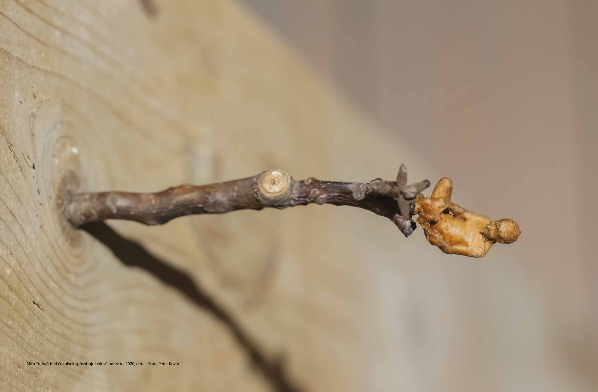
Miro Trubač: Keď čokoliek spôsobuje bolesť, odrež to, 2020, detail. Foto: Peter Kováč