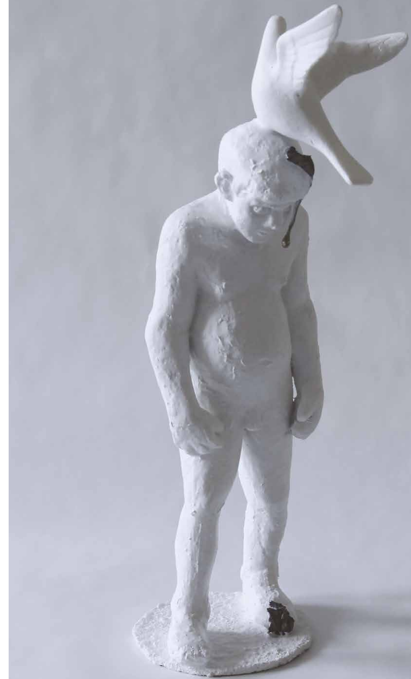
Miro Trubač: Duch Svätý, 2019, kolorovaný epoxid, bronz / Holy Spirit, 2019, coloured epoxide, bronze, 35 x 15 x 43 cm.