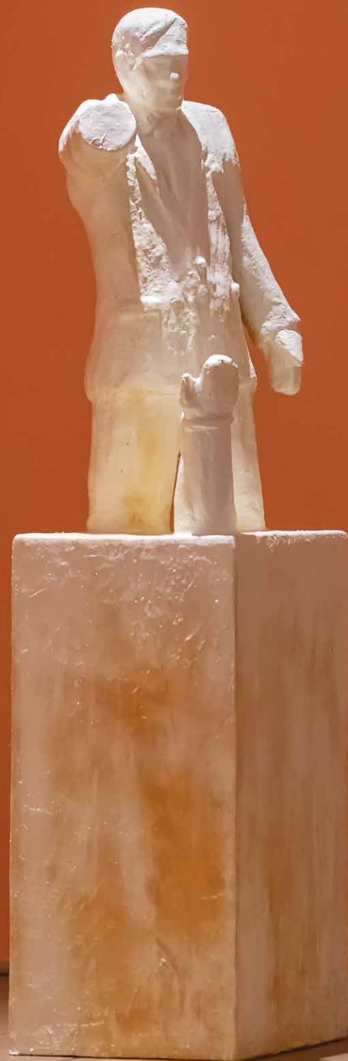
Miro Trubač: Na konci ruky, 2020, kombinovaná technika / At the End of The Hand, 2020, mixed media, 27 x 97 x 22,5 cm. Foto: Peter Kováč

Figurálnosť v Trubačovej tvorbe znamená možnosť vytvárania naratívu, v ktorom je figúra príbehovným prvkom. Dalo by sa povedať, že tvoriť figurálne predstavuje pre Trubača schopnosť organizovať scénu, ktorej je režisérom. Základom princípu jeho naratívneho koncipovania zobrazeného je zastavenie scény v momente tesne pred vyvrcholením deja. Tým dáva autor možnosť divákovi scénu čítať ako príbeh napriek tomu, že je statická. Divák môže dedukovať, čo jej predchádzalo, i to, ako sa bude vyvíjať. Takéto konštruovanie môže súvisieť na jednej strane s tradíciou figurálneho sochárstva, ktorej korene možno vysledovať až do antiky, a na druhej strane s filmovými a komiksovými zdrojmi, z repertoára ktorých autor opakovane čerpá. Priznáva svoj vzťah k hrdinským príbehom s archetypálnymi prvkami, ktoré refiguruje pre potreby autorského rozprávania.